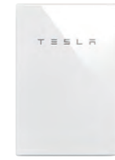
プランC 13.5kwh大容量蓄電池